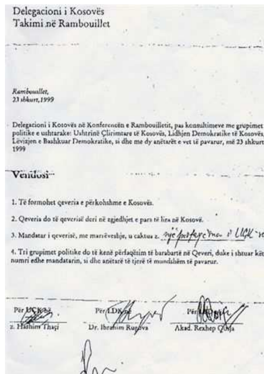
Marrëveshja për formimin e një qeverie të unitetit - 23 shkurt 1999.