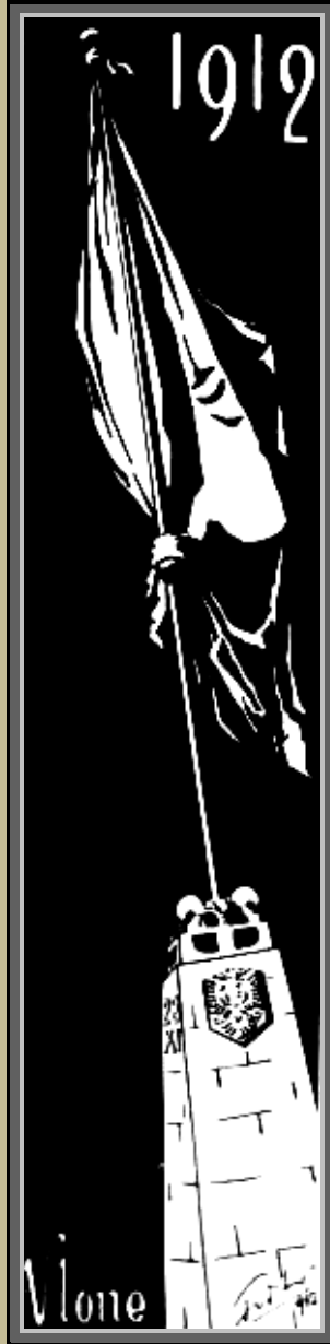
Vlonë 1912. (Grafikë nga Fritz Radovani 1962).