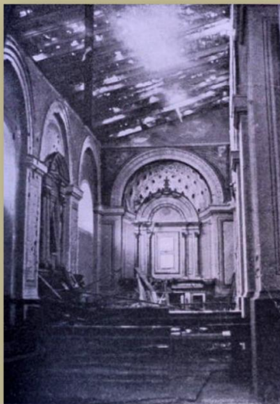
1913. Tavani i Kishës Katedrale (nga ana e majtë) i hapun nga gjylet e topave të malazezëve...

Si për inat të turkut e të sllavit...edhe sot!