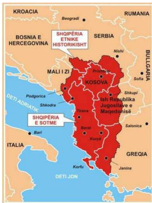
Territori ku jetojnë shqiptarët