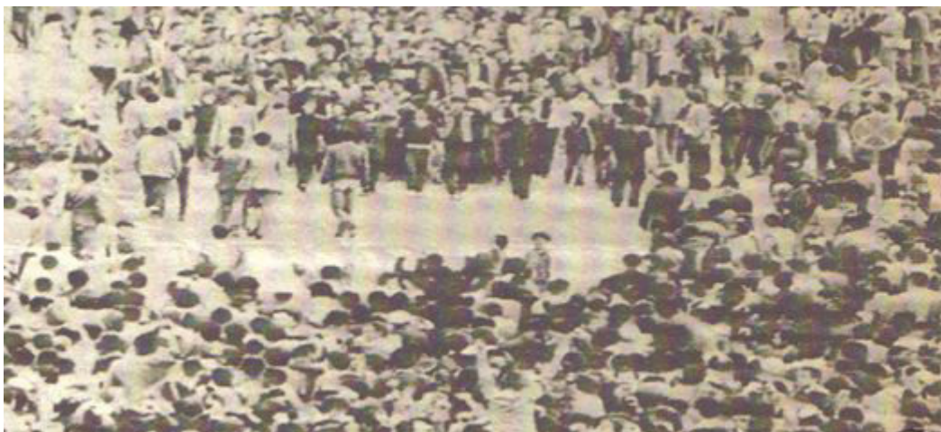
Foto e një demonstrate të rinisë së Kosovës gjatë vitit 1981