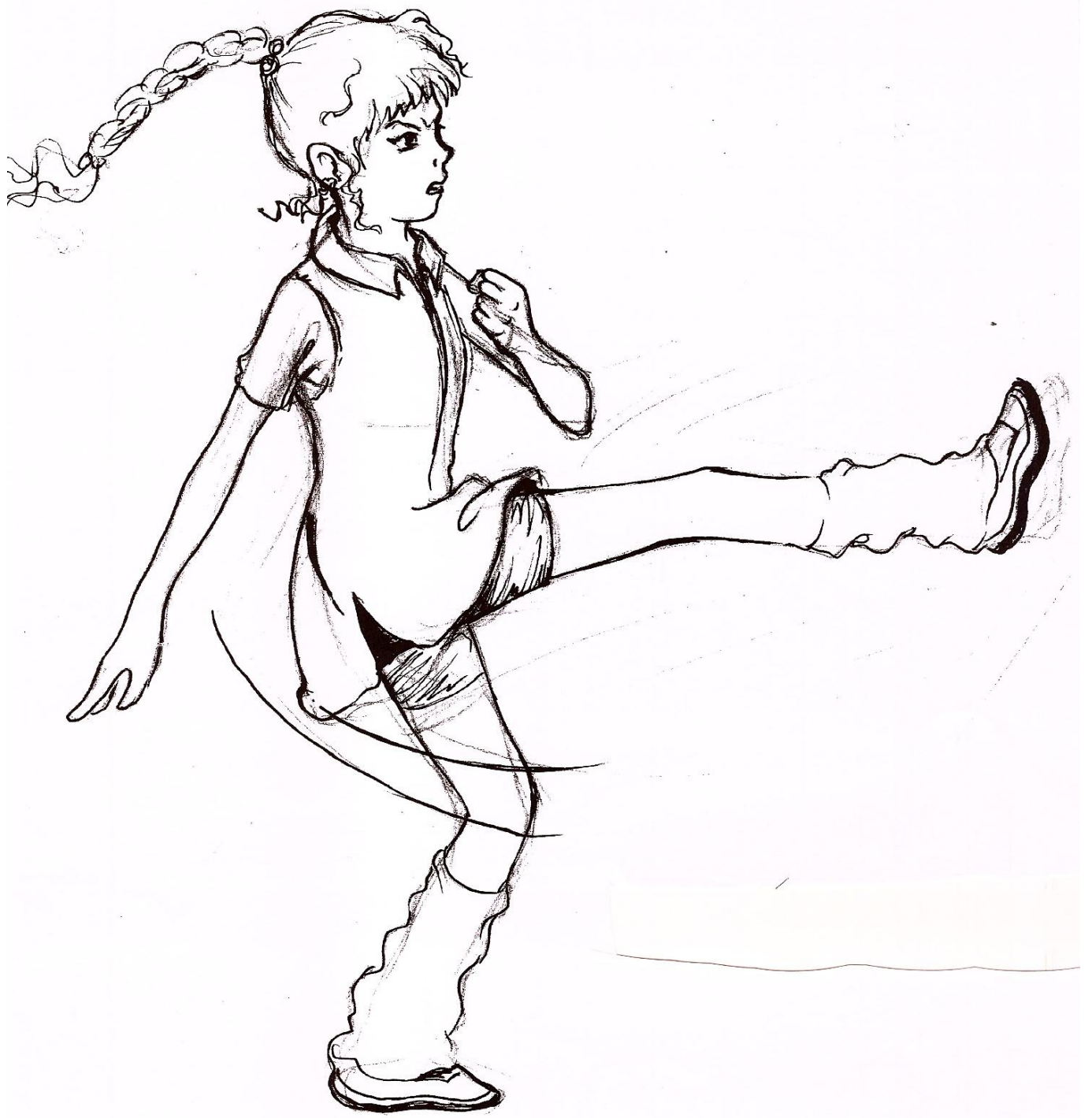
Goditja me shkelm