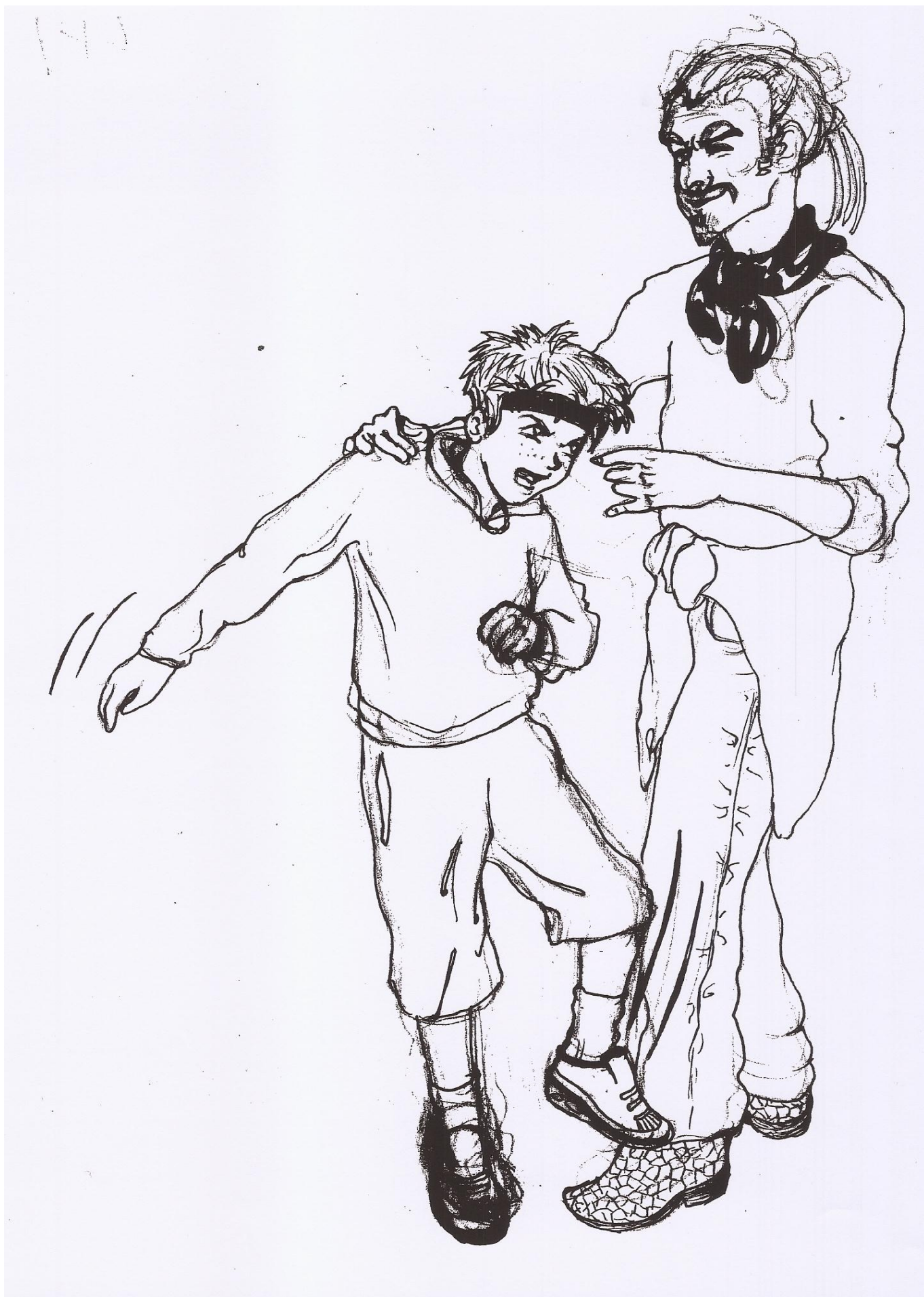
Goditja me shkelm në këmbë