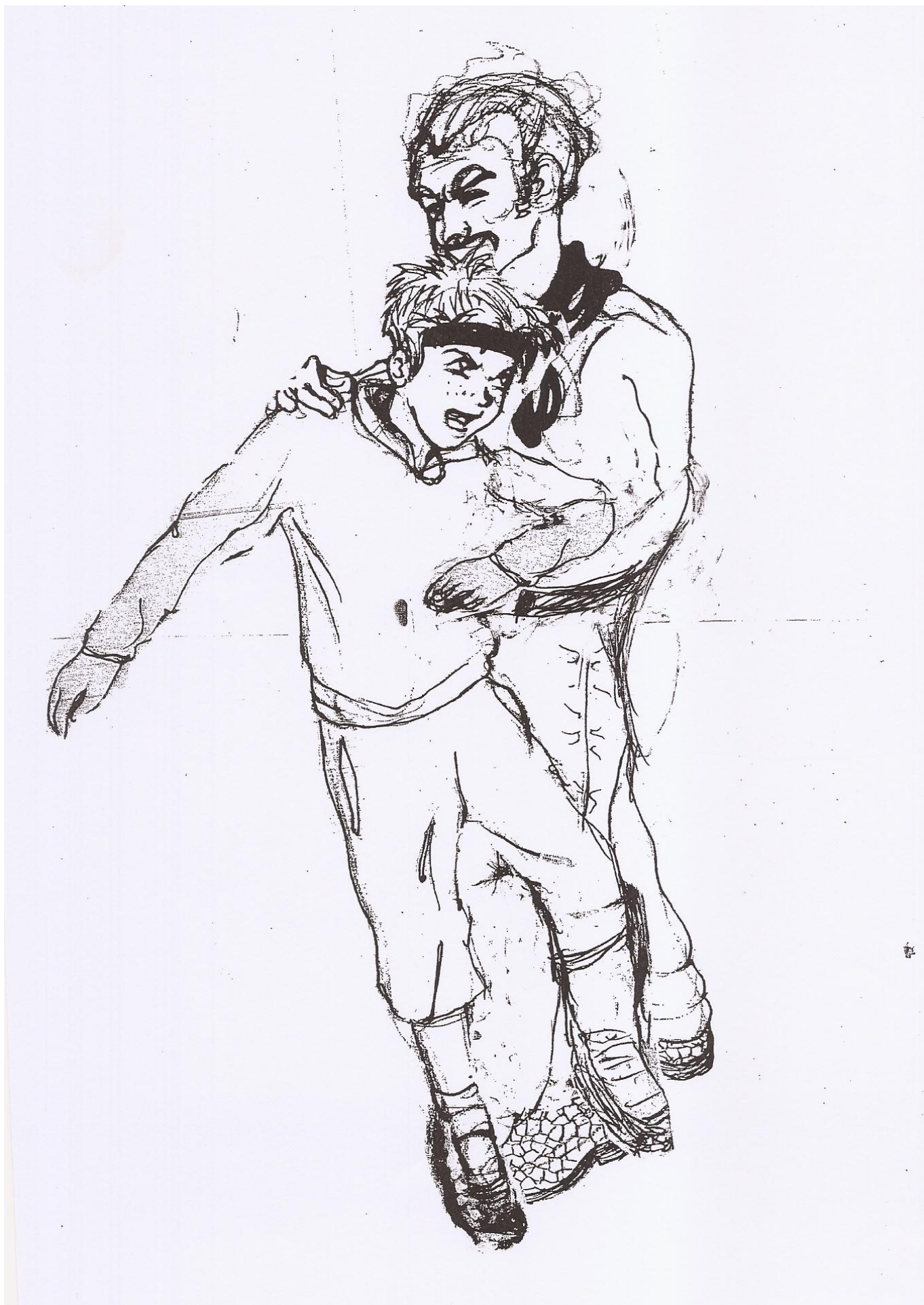
Goditja me bërryl në stomak