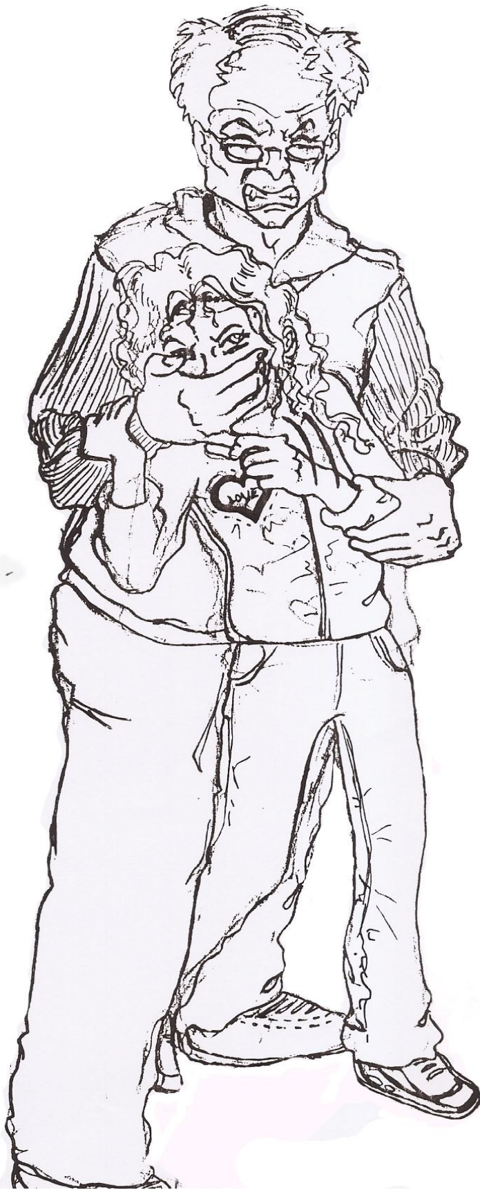
Manovra për tu liruar, përdredhja e gishtit të vogël të agresorit.