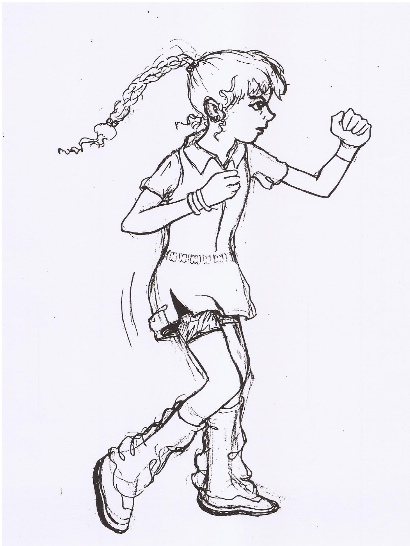
Goditja me grusht