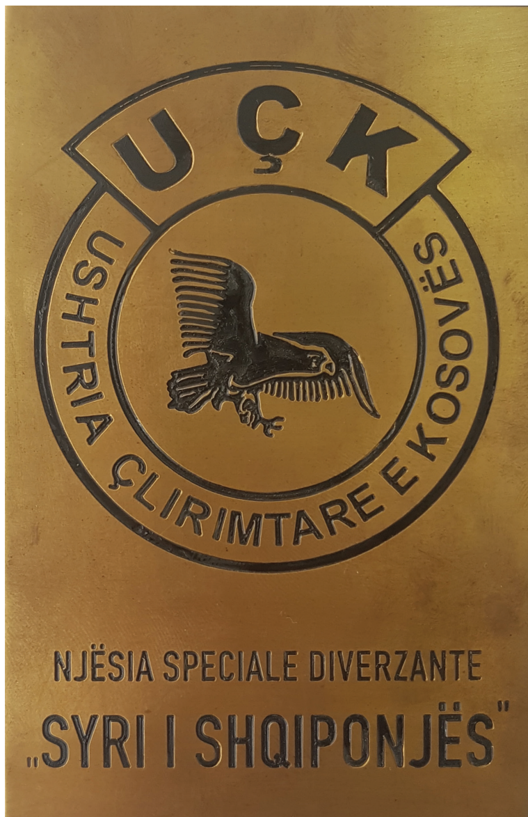
Emblema e njësitit special Syri i Shqiponjës.