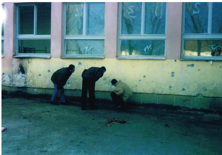
Gjurmët e masakrimit serb të 23 të rinjve shqiptarë në Bukosh të Therandës, më 3 maj 1999.

Pas luftës shkolla u rindërtua sërish. Abetarja e parë u shkrua me gjakun e martirëve rrzëzë mureve të saj. Gjurmët e gjakut dhe të plumbave të këtij krimi barbar serb janë ende në muret e shkollës, bashkë me pllakën përkujtimore me emrat e martirëve. Ato ia përkujtojnë brezit të ri çmimin e shtrenjtë të lirisë.