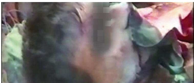
Ushtarë serbë të vvarë në rrethin e Therandës.

Shumica e tyre ishin eliminuar bashkë me tri makinat e blinduara të bëra shkumb e hi, ku në secilën sosh mund të kishte së paku nga 5-6 ushtarë.