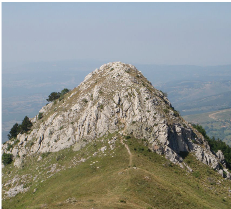
Guri i Brumullakët në Bjeshkë të Bukoshit