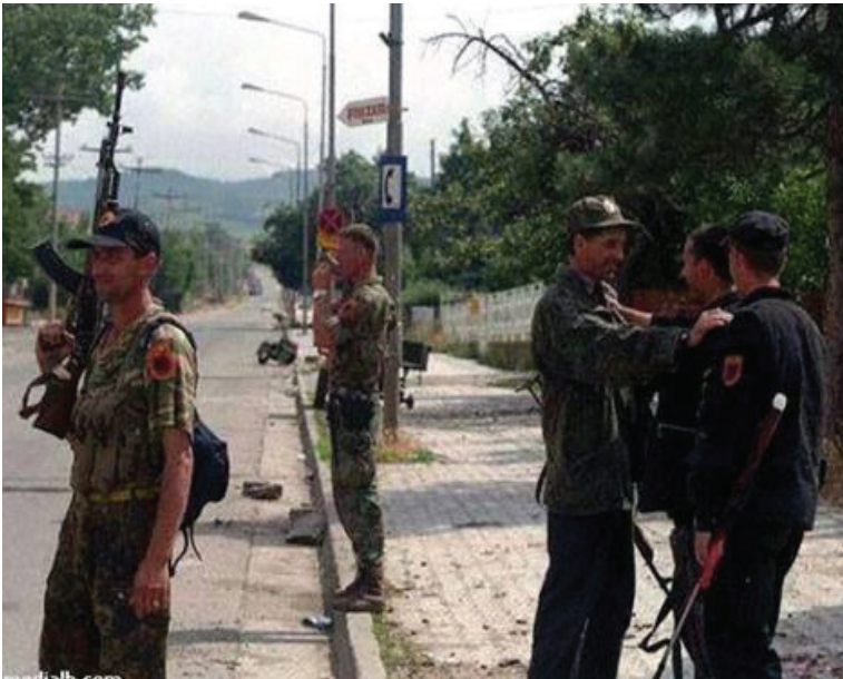
Çlirimi i Therandës, 13 qershor 1999.

Qyteti ishte rrënuar e djegur pothuajse tërësisht nga armiku, ishte i zbrazët dhe nuk dëgjohej zë njeriu. Nga terrori serb ishin larguar edhe zogjtë, lëre më njerëzit. Dëgjohej vetëm krrokama e korbave, si një iso e krimeve fashiste serbe, duke u ushqyer me kufoma të civilëve e kërma të bagëtive kudo nëpër oborre, kopshte e nëpër rrugët e qytetit.