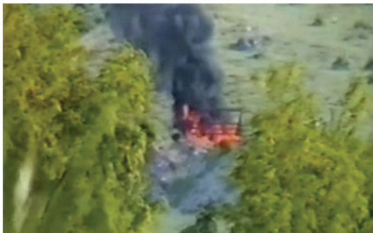
Transportuesi serb digjet bashkë me ushtarët përbrenda, Vneshtë, 12 maj 1999.

Nuk vonoi shumë dhe para nesh u shfaq autotransportuesi i ushtrisë serbe. Nga të tri pritat shkrepëm përnjëherësh rafale automatikësh e mortaja dore. Transportuesi me ushtarë e municion u përplas në anën e djathtë të rrugës, nga ku mund të goditej më lehtë.