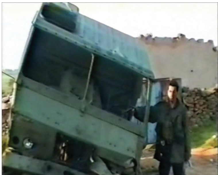
Makineria ushtarake serbe e shkatërruar nga Syri i Shqiponjës, Peqan, 24 maj 1999.