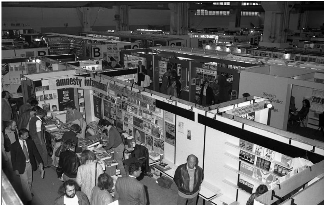
14. Oktober 1981