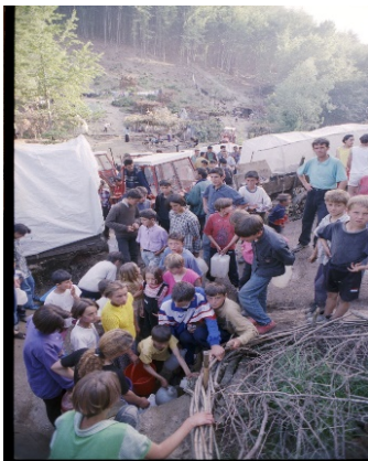
Arkivi I Kosovës/ Kosova 1999/ Foto nga Paul Refsdal_ Gazetar Norvegjez

Dogana Jugosllave në kufi. Kërcënime të hatashme për dorëzimin e të gjitha dokumenteve. Maltretime të panevojshme dhe zhurmë e tmerrshme nga gdo anë. Kjo gjendje edhe më tepër rritej nga lodhja, nga etja dhe nga uria. Përkundër këtyre rrethanave, syri më shkoi në një pikë pak më larg. A është e mundur ta shoh atë që po e shoh? Flamuri ynë! Më dukej ëndërr. A do të mund të arrijë ndonjëherë nën atë flamur, për të cilin dikur nuk kemi guxuar