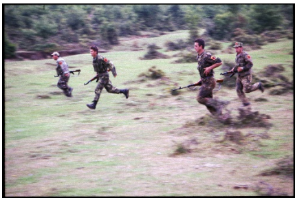
Arkivi I Kosovës/ Kosova 1999 / Foto nga Paul Refsdal_Gazetar Norvegjez

Ç'të shohim? Shkrumb e hi. Si nuk e paskan harruar asnjë shtëpi pa e djegur. Edhe kështu të djegura, ato ruanin krenarinë e vet, me bukuri natyrore rreth e rrotull tyre.