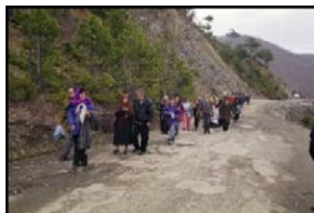
Arkivi I Kosovës/ Kosova 1999/ Foto nga Paul Refsdal_ Gazetar Norvegjez

Mjaft të mërzitur, filluam rrugën kështu rreth njëqind vetëve. Pak më tutje, numri shumë shpejt arrijti rreth gjashtëqind vetë. Krahas nesh ishte vargisur kolona e traktorëve dhe e qerreve të ngarkuara nga njerezit me shikime të dehura e të humbura, pa ditur saktësisht se çka po ndodhë me ta. Ashtu të humbur, mezi fshehnin shikimet e tyre, duke i larguar sytë nga shikimet tona, sigurisht lakmuese, për të gjetur edhe në ndonjë skutë në qerret e mbingarkuara të tyre.