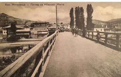
Ura mbi lumin Ibër_1929