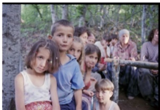
Kosova 1999

Por, jo. Ato ishin të njehta, pa kurrfarë ndryshimesh nga dita e mëparshme. Pa kurrfarë- initiative për të ndërmarrë diçka të nevojshme. Pasi që brenda, shporeti ishte më pak i ngarkuar, shpejt e shpejt propozova t'a gatujmë edhe një tepsi me gurabia, ushqim i përshtatshëm për rrugë. Shumicën e gjërave të nevojshme për gatimin e tyre siguroam nëpër shtëpinë ku ndodheshim. Sa mendonim se siguroam sadopak ushqim, shpejt harxhohej. Çfarë të bëjmë? Burrat që gjendeshin me ne, u munduan, përmes disa miqve që gjendeshin aty, t'a siguronin ndonjë autobus. Edhe kjo përpjekje dështoi. Qartë dukej se çdo minut i mëtejshëm qëndrimi, për ne bëhej vonë, dhe vetëm na