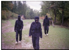
Arkivi I Kosovës/ Kosova 1999/ Foto nga Paul Refsdal_ Gazetar Norvegjez

- Po hyni në fshatin Çubrel! - vazhdoi zëri i ushtarit tonë. Nja 200 metra prej këtej kthehuni në të djathtë. Atje ju presin njerëzit tanë. Do t'a kaloni natën në shtëpitë që gjenden aty!