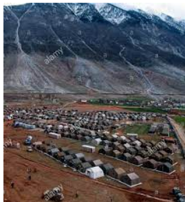
Kukësi 1999