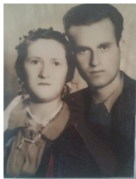
Gjyshërit e Artit

dije ti, me ndonjë kokërr sheqer, lugë mjaltë, llokum, ndonjë arrë... Kurrë nuk të mërziste.