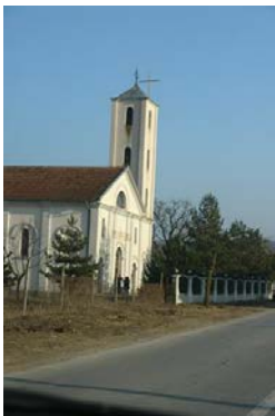
Kisha në Zllakuqan (Nga Mediat)

Fuqia na kishte lëshue plotësisht. Na kishte kapluar uri dhe etje e madhe. Dëgjuam se prifti na ftonte të hyjmë në oborrin e kishës. Dukej oborr i vogël por na zuri të gjithëve. Aty, para neve kishte arritë një kolonë e madhe që ishte nisë para nesh. Me të arritur në Klinë, forcat sërbe e kishin detyruar të kthehet prapa. Grupe-grupe u ulëm në barin e njomë. Nga dhembja e shputave të këmbëve, filluam t'i zbathim të mbathurat me kujdes. Nuk e dija a do të jemi në gjendje të vazhdojmë