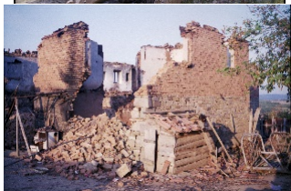
Arkivi I Kosovës/ Kosova 1999/ Foto nga Paul Refsdal_Gazetar Norvegjez

Të nemitur ecnim duke menduar për fatin e atyre njerëzve që kanë banuar këtu. Fati i njejtë, sikur i të gjithë shqiptarëve të Kosovës. Ah! Shqiptarët e Kosovës - Kosova. Shumë e shumë legjenda, këngë e vjersha janë thurë për ta, që të gufon zemra sa herë që i dëgjon. A është e mundur të përsëritet prap historia dhe të biem në këtë nivel kaq të mjerë? Jemi pjesëtarë të dramës së zbrazjes totale e rrënqethëse të Kosovës. Kurfar mundësie