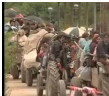
Arkivi I Kosovës/ Kosova 1999/ Foto nga mediat

O Zot! A do të ndalet ky shi ndonjëherë apo do të vazhdojë kështu tërë kohën? Përkundër këtij moti, të gjithë që gjendeshin pa transporte, na bashkangjiteshin me një disponim, thujse e gjetën shpëtimin. Numri i kolonës vazhdimisht rritej.