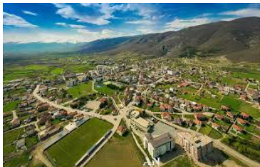
Fshati Zabllaq

Fshati quhej Zabllaq. I përkiste komunës së Istogut. Ne gjindeshim në shtëpinë e Ahmetajve. Pronarët filluan ta vizitojnë shtëpinë çdo ditë, në menyrë mjaft të fshehtë. Pos kullës kishin edhe katër shtëpi identike, të posandërtuara dhe të meremetuara, dy të qëlluara me granata. Edhe ata, sa u lejonte mundësia, merrnin gjëra ushqimore dhe shikonin shtazët shtëpiake.