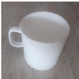
Gota nga e cila Arti piu qumshtin me të hyrë në Shqipëri

që ishin zgjatë kah gota e bardhë, e mbushur me qumështë të nxehtë. Në fillim, nuk desha t'ia epja, pasi që mu duk tepër të nxehtë për te. Filloi të dëneste dhimbshëm duke e kërkuar, pa durim për të pritur të ftohet pak. Ofroi buzët e thara dhe aspak nuk i pengoi nxehtësia e tij. Thithte me ëndje të njejtën aromë sikur gjithë të tjerët. Më dukej se i kthehej freskia që diku thellë në brendi e kishte ruajtur për truallin e lirë shqiptar. E piu të tërin.