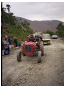
Arkivi I Kosovës/ Kosova 1999/ Foto nga Paul Refsdal_ Gazetar Norvegjez

Edhe ata njerëz nëpër traktorë, ndoshta kishin arsye për sjellje të tilla. I kanë kapluar ethet e luftës. Frigë nga uria. Luftë për egzistencë. Kush e di me çfarë torturash janë larguar nga vatrat e tyre shekullore, nga shtëpitë e tyre, që tani nuk janë në gjendje të mendojnë arsyeshëm as për vete, e lëre më për ne që na dukej se çdo fije fati na e kishte kthyer shpinën.