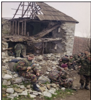
Kosova 1999

Pa marrë parasysh pasojat, edhe në këto momente, në thellësi te trurit , jam më e qetë sesa më parë.