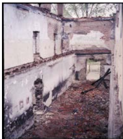
Arkivi I Kosovës/ Kosova 1999/ Foto nga Paul Refsdal_ Gazetar Norvegjez

Nga lodhja mezi u vendosa në një skutë të një dhome të zhveshur nga plaçkitjet. Tani ishte errësuar thuaja krejtësisht. Artit, menjëherë ia zhvesha pantollonat ende të lagëta dhe e mbështolla me batanie. Kjo natë kaloi pothuajse pa pushim, pasi që Artit çdo minut i keqësohej gjendja. Tërë natën kërkonte ujë, të cilin pa e gëlltitur mirë, e villte. Kah mëngjesi i mbyllëm pak sytë. Në të vërtetë unë i