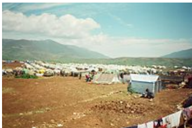
Kukësi 1999_Foto e huazuar nga mediat

përngjante një kuvendi madhështor, që do të lë gjurmë të thellë në historinë tonë.