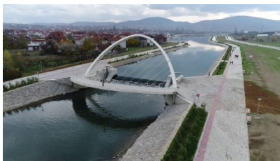
Ura mbi lumin Ibër_sot