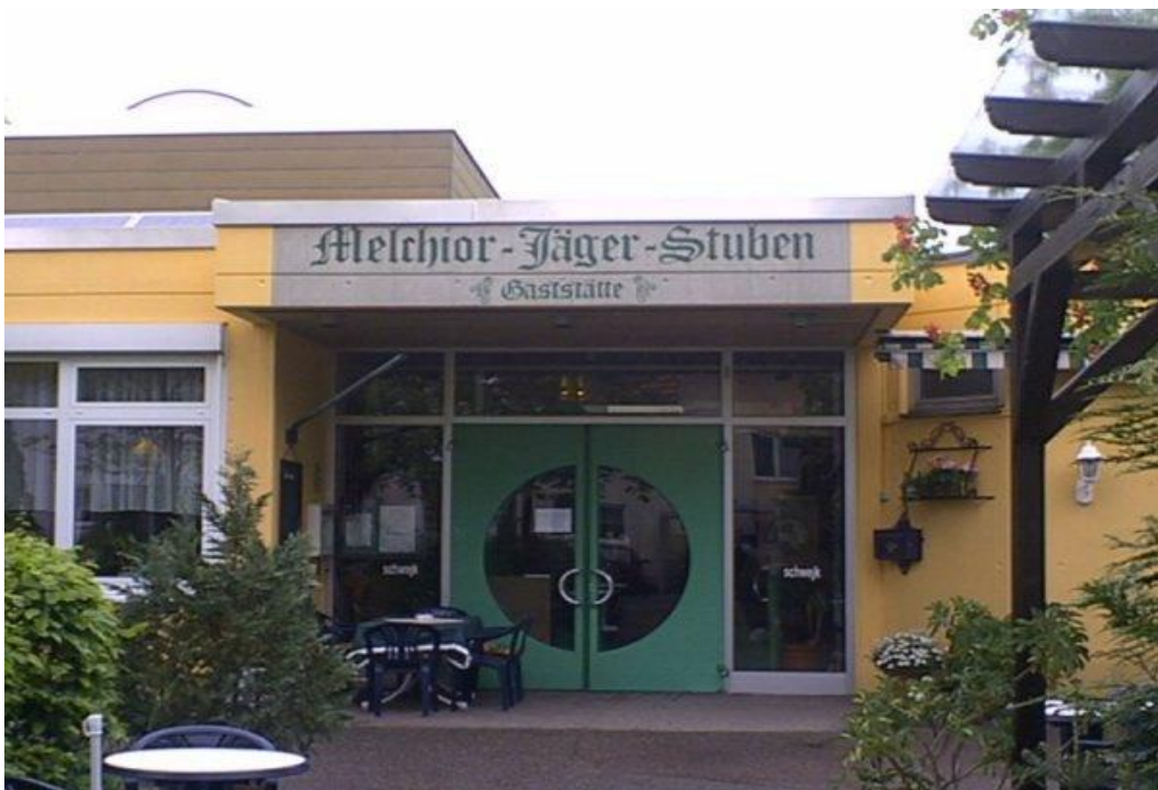
Salla në Höpfigheim (Melchior - Jägerstuben, Burgunderstraße 4) ku u festua 28 Nëntori i vitit 1981